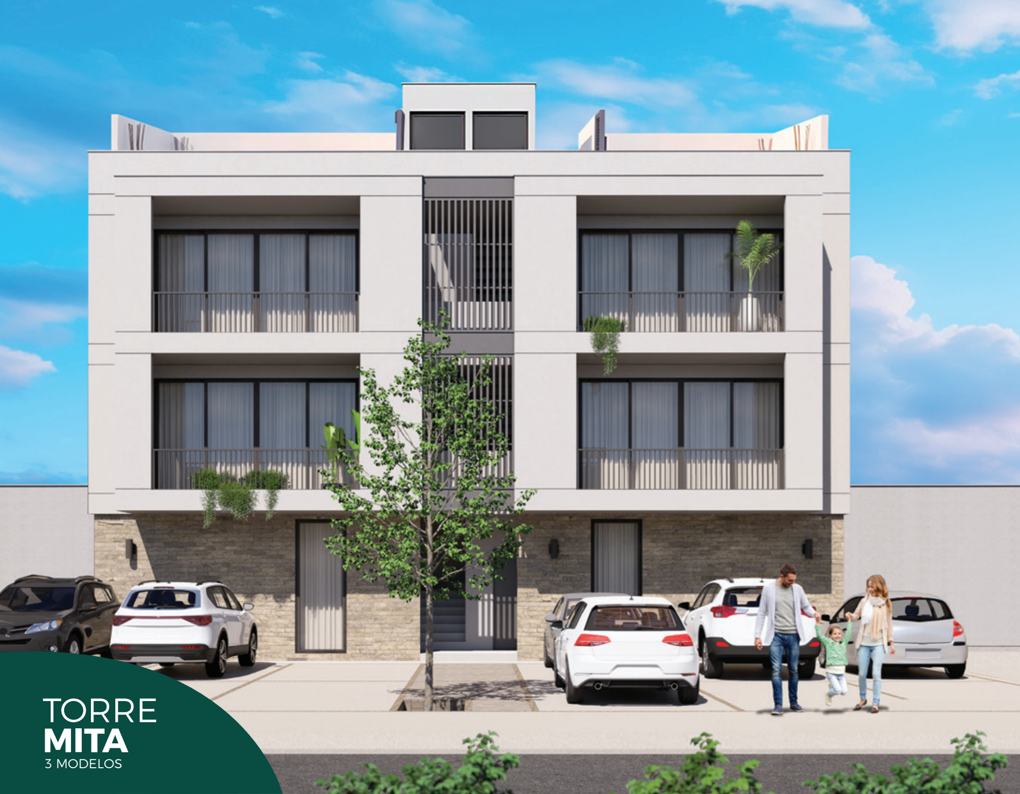
TORRE MITA 3 MODELOS