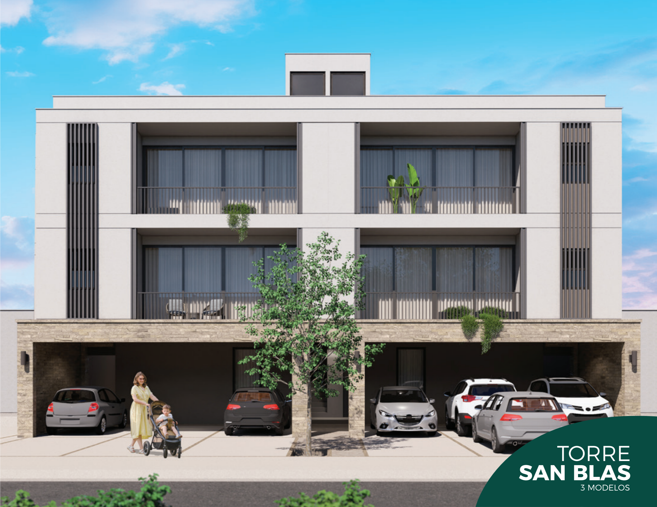
TORRE SAN BLAS 3 MODELOS